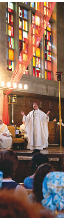
Am 9. Juni errichtete Bischof Felix in St. Anton feierlich den neuen Pastoralraum Basel-Stadt. (Bild oben und Titelseite)