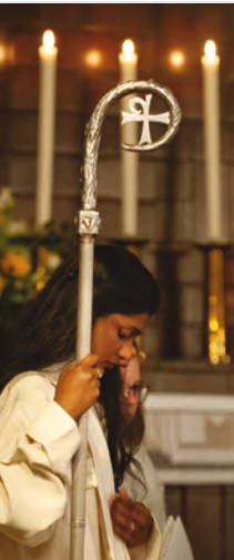
Impression vom Festgottesdienst zur Errichtung des Pastoralraums Basel-Stadt.