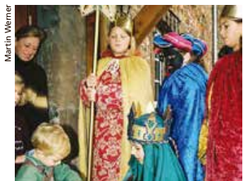
Am 6. Jan. im Kleinbasel unterwegs.