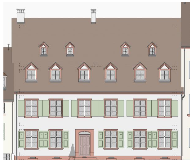
Fassade Nord - Innerhof