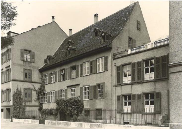
Fassade Süd - Rhein Foto Jahr 1946

Die Liegenschaft wird 1559 erstmals ausdrücklich als zum Anwesen gehörendes Wohnhaus erwähnt. Der ursprüngliche Bau wurde zur damaligen Zeit um ein Drittel verlängert. Ein Umbau im 18. Jahrhundert gab dem Haus seine heutige Form. Ein Ausbau des oberen Geschosses ist 1845 überliefert. Der Anbau einer Laube hofseitig und einer Altane rheinseitig erfolgte 1865. Beide Anbauten sind 1948/1949 wieder entfernt worden.