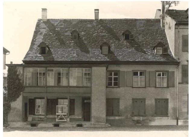
Fassade Nord - Innenhof Foto Jahr 1946

Die älteste im Inneren sichtbare Bausubstanz ist der Balkenkeller im Sockelgeschoss aus dem 16. Jahrhundert, welcher als Aufbewahrungsort diente. Tiefgreifende Umbauten 1948/1950 und 1984 haben zur weitgehenden Reduzierung der originalen Bausubstanz beigetragen. Zur Ausstattung des 18. Jahrhunderts zählt die Eichentreppe, welche vom Erdgeschoss ins 1. Dachgeschoss führt. Im Weiteren wurden zwei historische Bretterdecken bei den letzten Umbaumaßnahmen entdeckt. Die Decken enthalten Dekorationsmalereien mit Motiven aus Wolkenbänder mit Mond und Sternen, sowie Engel auf Wolken.