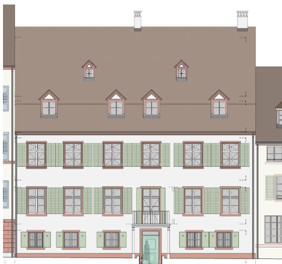
Fassade Süd - Rhein

Der Kirchenratsaal bleibt zur Nutzung durch die Mitglieder der RKK und Externe bestehen und erhält eine Teeküche im Saal und eine separate WC-Anlage. Der Stützbalken im Kirchenratsaal wurde als Sofortmassnahme bereits zusätzlich verstärkt.